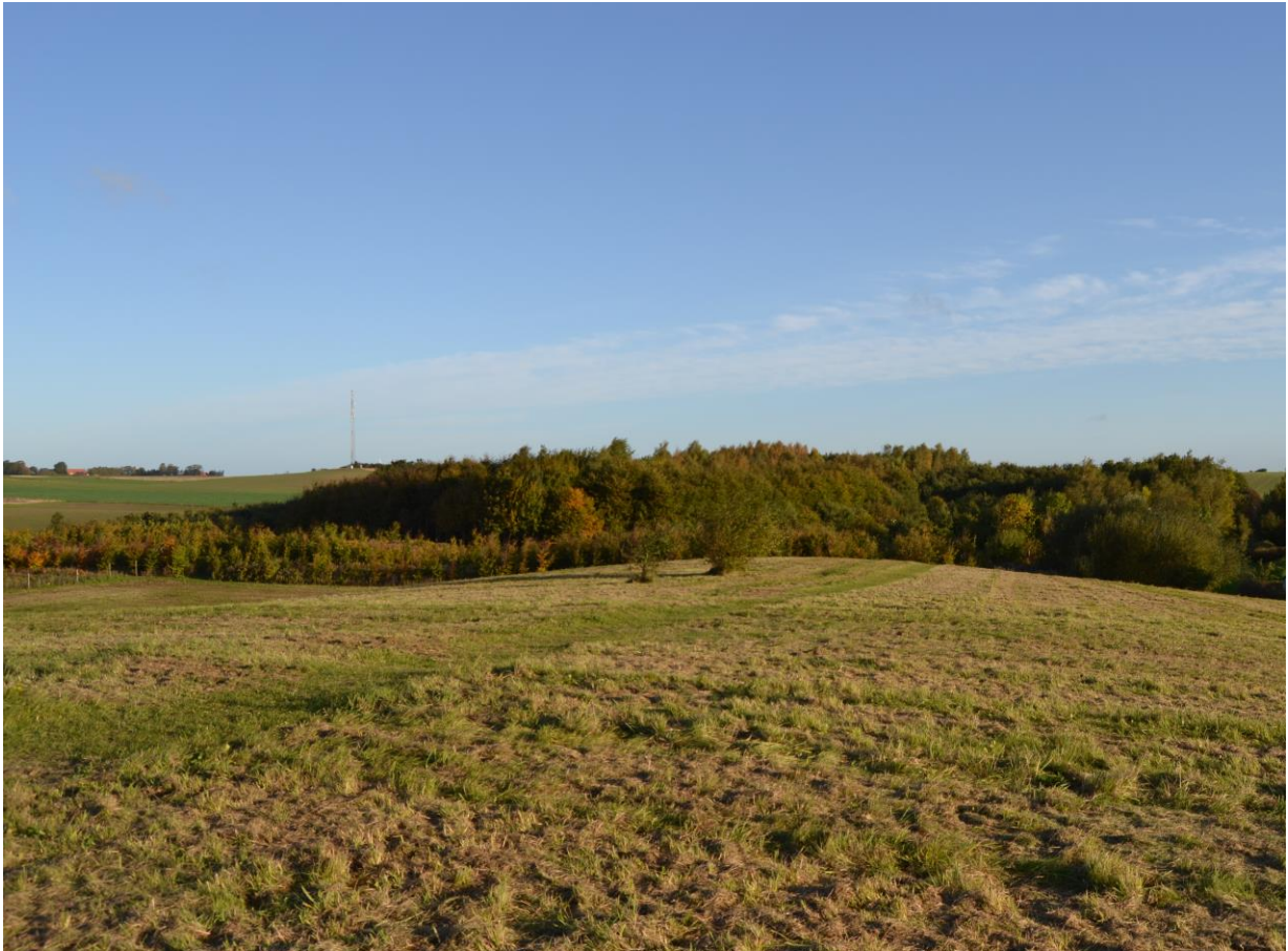
Skoven set fra Gåsebjerg.