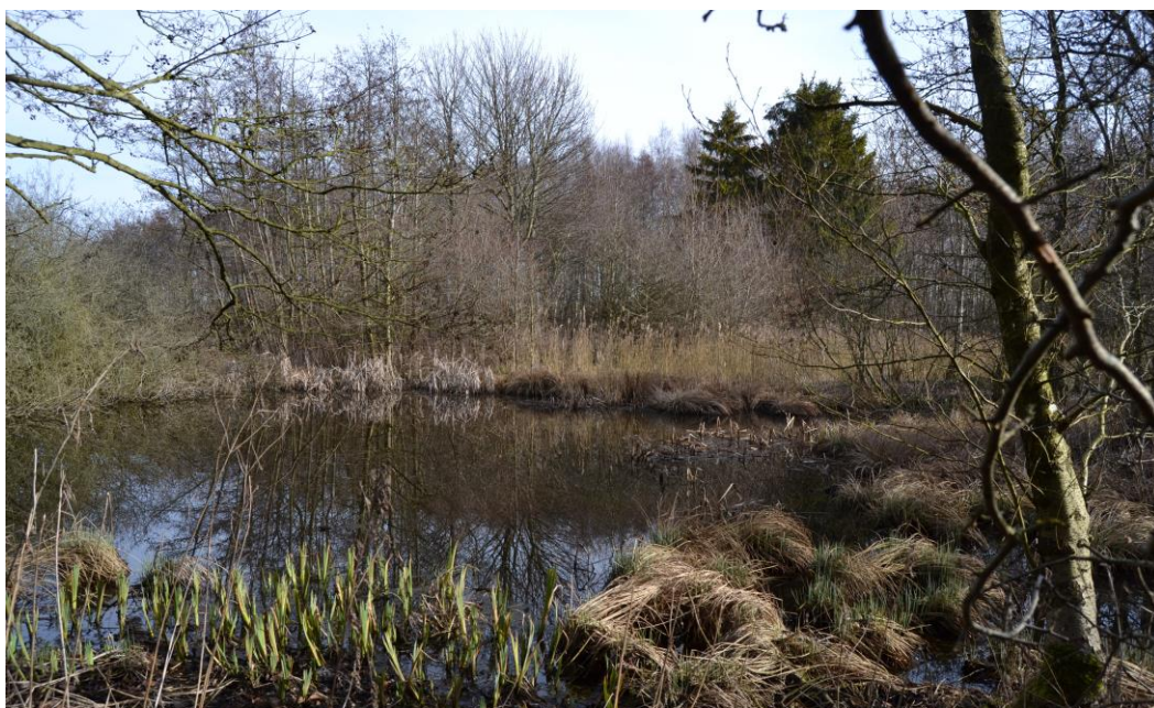
Søen tidligt forår.

Vi har igennem 2 år jævnligt besøgt området og har kortlagt især floraen, men vi har også registreret, hvad der er observeret af fugle, andre dyr og insekter. Alt dette er listet op bagest i denne lille rapport, et sp. efter en art betyder, at arten ikke er nærmere bestemt. Trods alle disse besøg kan flere arter være overset, og der er sikkert nogle planter, dyr og insekter, vi ikke har mødt endnu. Der vil også gennem årene ske en ændring i sammensætningen af både plante- og dyrebstanden, naturen veksler hele tiden, noget forsvinder, og nyt kommer til. Således var der tidligere Gøgeurter i kanten af mosen, disse er siden forsvundet på grund af tilgroning, Men hvis man rydder lidt buske og træer her, kan de måske dukke op igen.