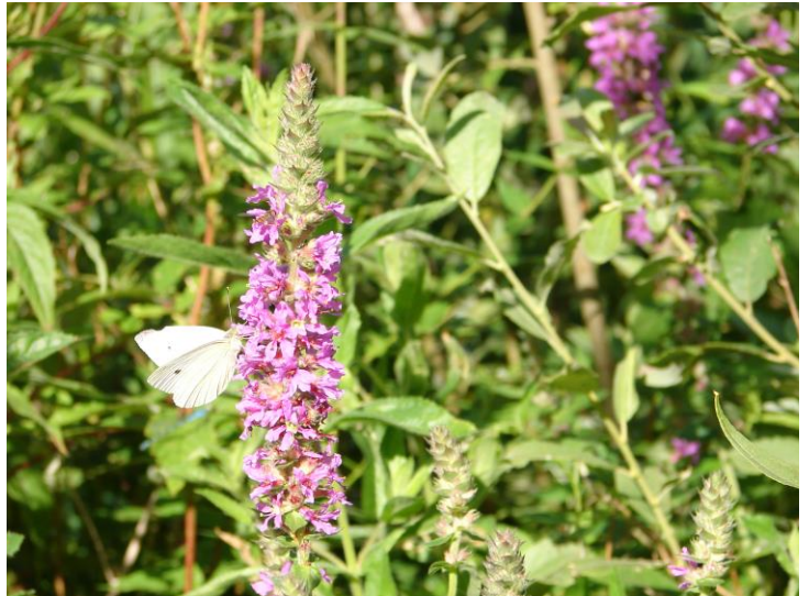
Tv. Kål-Tidsel. Kålsommerfugl på Kattehale.