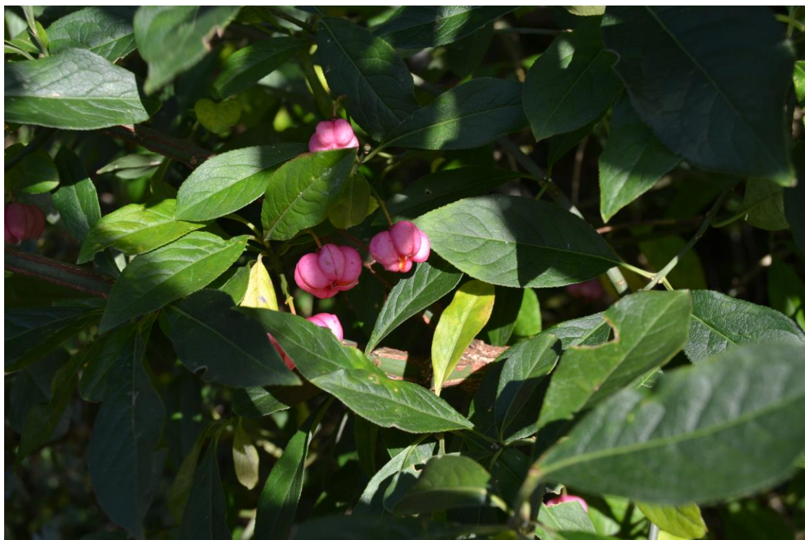
Bened.