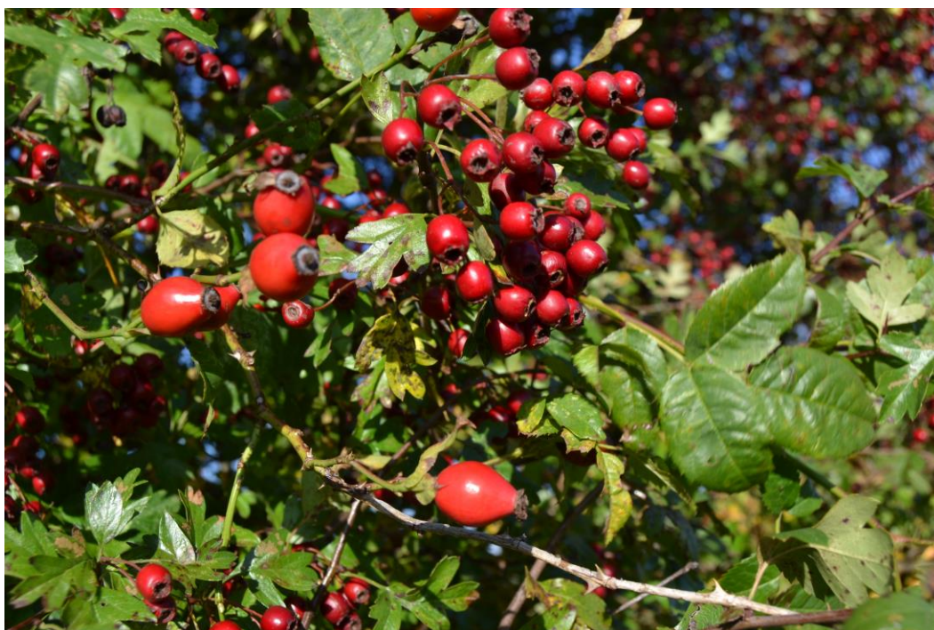
Hyben fra Glat Hunde-Rose og de mindre bær fra Hvidtjørn.

Der er registreret næsten 60 forskellige buske- og træarter. Rigtig mange af disse er ikke egentlig hjemmehørende i det, vi opfatter som skov. Det drejer sig f. eks. om træer som Skyrækker, Guldhængepil, Ærtetræ m.fl. Buske som Forsythia, Dronningebusk og Rhododendron er jo heller ikke lige det, man forventer at finde i en skov, men det gør kun oplevelsen så meget større, når man går rundt i området.